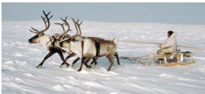
(c) Exposition vivre avec les rennes