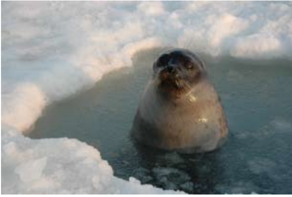
(c) Eric Brossier, Vagabond voilier polaire